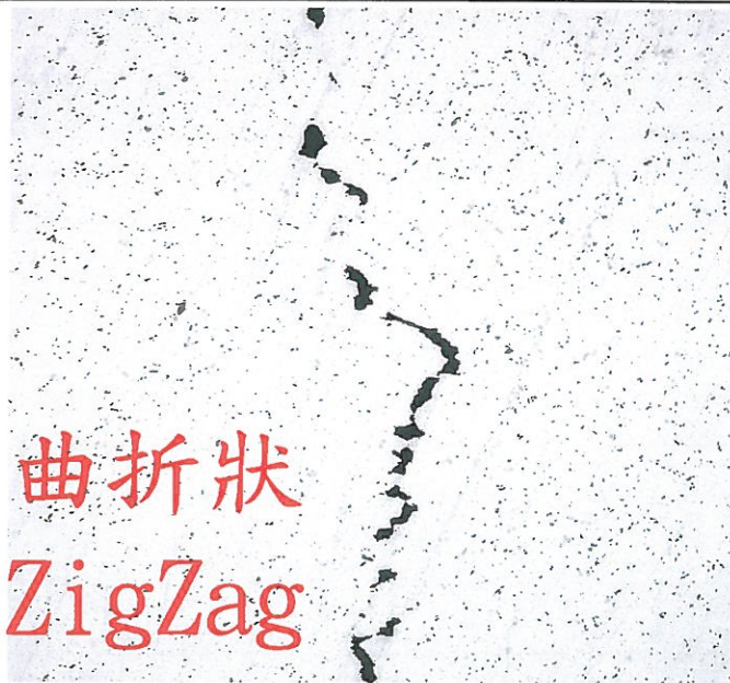
圖(3) 開裂樣品金相橫切面 100X