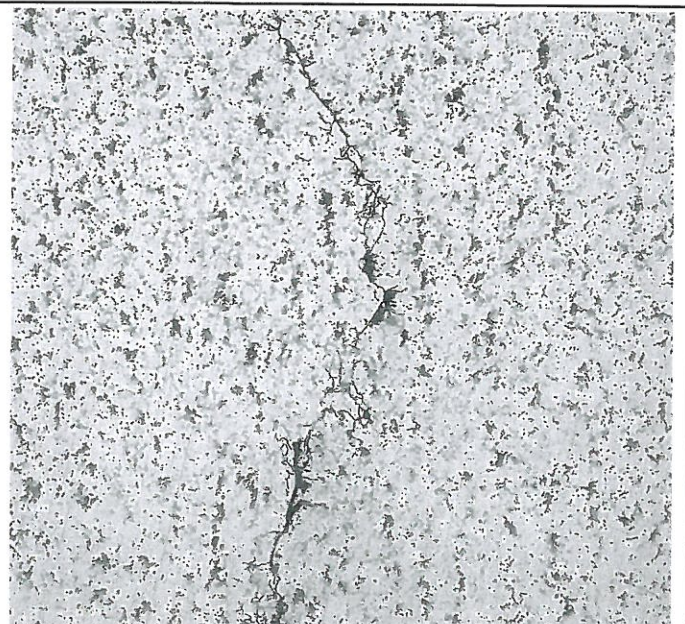
圖(4) 開裂樣品金相橫切面 200X Picral