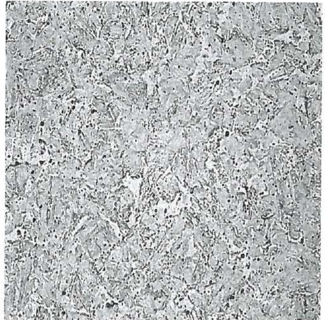
圖(4)開裂樣品金相橫切面 500X Picral